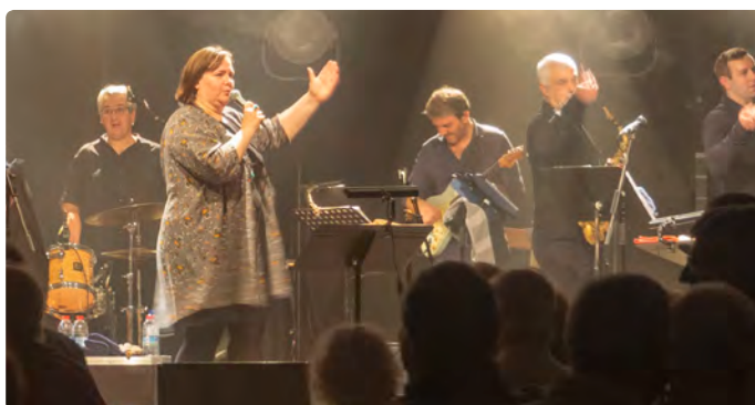
L'hommage à Aretha Franklin par Captain en clôture du Festival le samedi 26 octobre à Maignelay-Montigny.