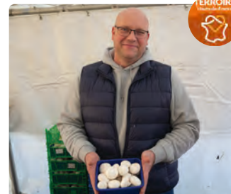
La champignonnière de la Croix-Madeleine • Ludovic Barré • Bailleval Champignons