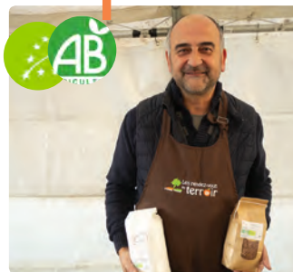
La ferme du Bel air • François Lefevre • Le Plessier-sur-saint-Just Pommes de terre, lentilles, farine